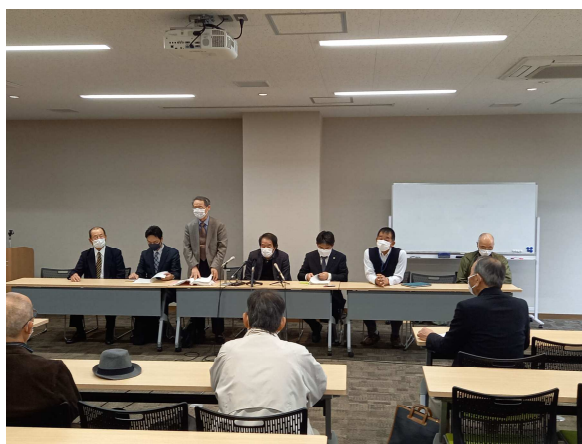
庄原市バイオマス訴訟 広島地裁判決報告会 (2022年3月30日)