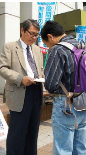
1時間で183人分の署名が集まりました