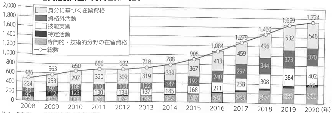
資料1 在留資格別外国人労働者数の推移